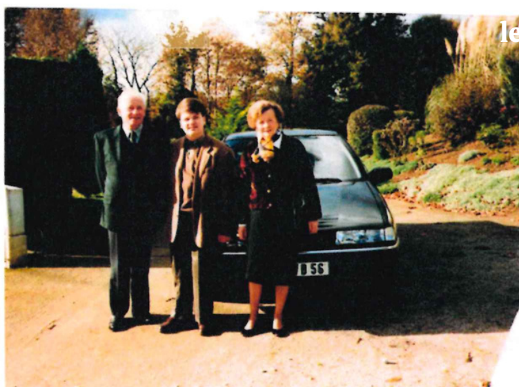
Photo prise avant d'aller au mariage de peht-neveu de Desiré LE BOULCH