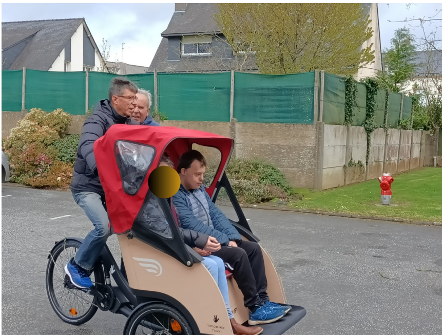
1er essai pour le triporteur sur le parking de l'EHPAD. Les résidents du Foyer de Vie sont venus le découvrir et ont apprécié la mini ballade.