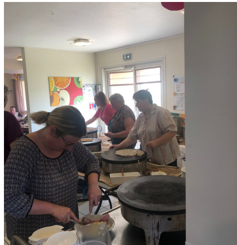
Le repas crêpes est toujours un moment très apprécié des résidents